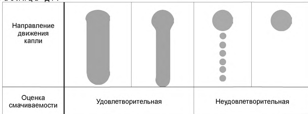
Т а б л и ц а Д . 1

Показатель смачиваемости определяют по форме следа движения капли, оставленного на поверхности фольги (рисунок Д.1).